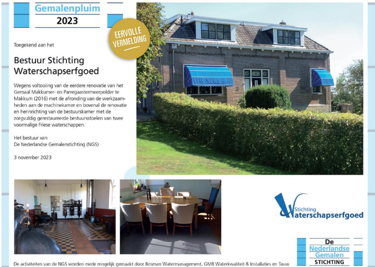
Foto van de uitgereikte oorkonde/eervolle vermelding voor het restaureren van de bestuurskamer van het Gemaal Makkumer- en Parregaastermeerpolder te Makkum

machinekamer, maar bovenal voor de restauratie van de bestuurskamer in het Gemaal Makkumer- en Parregaastermeerpolder te Makkum (1882).